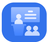
Nivel de sala de clases (docentes y estudiantes)