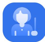
Nivel docente y departamento de aprendizaje